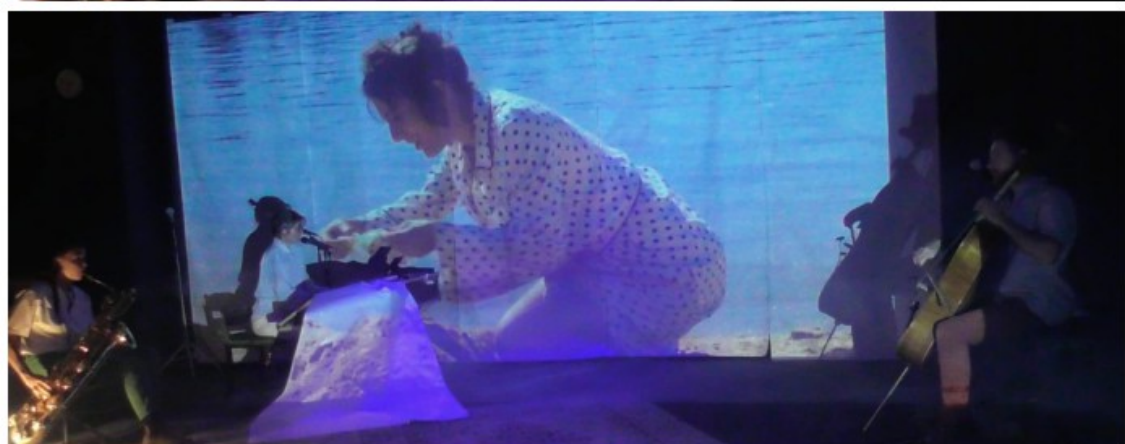
Images de répétition montrant la mise en scène du poème cinématographique