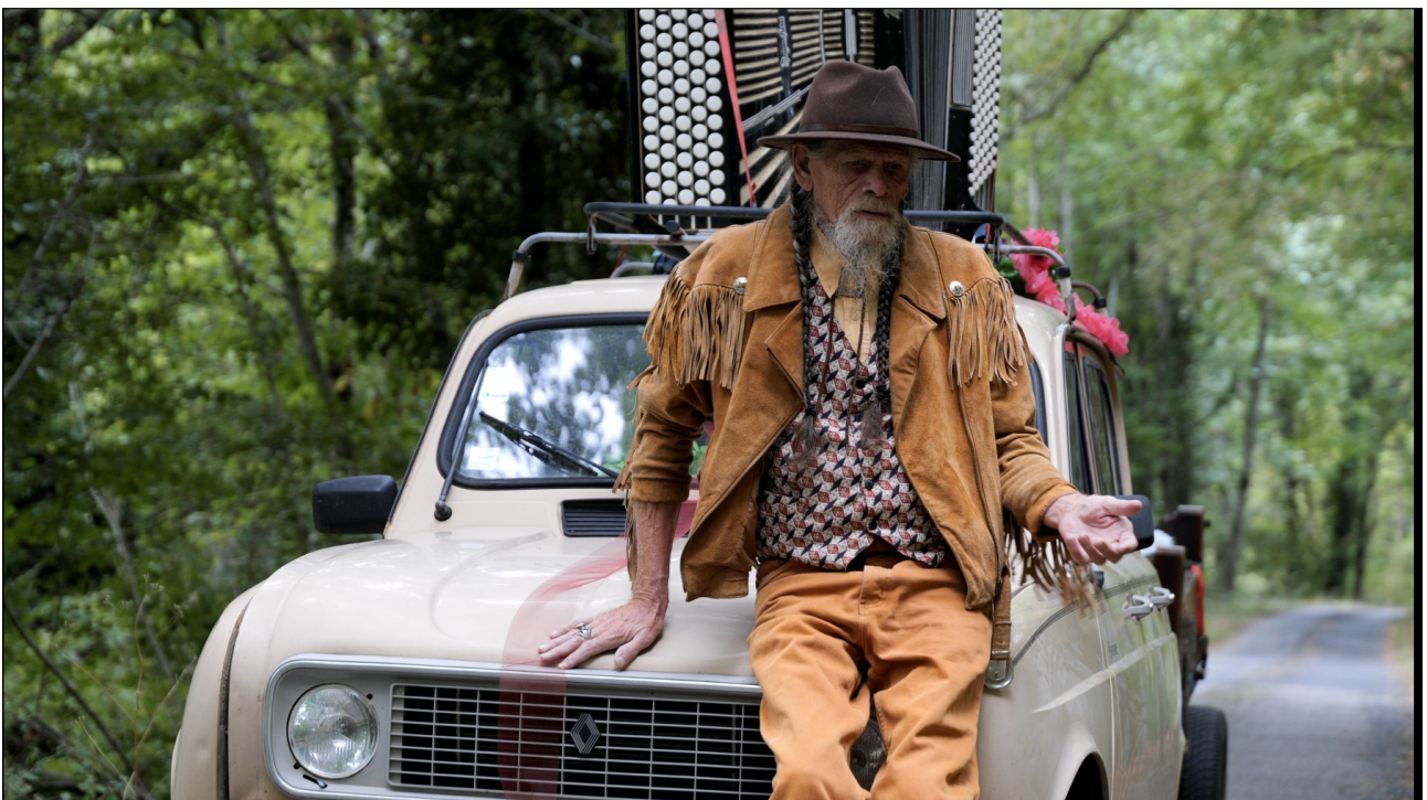
Extrait du film