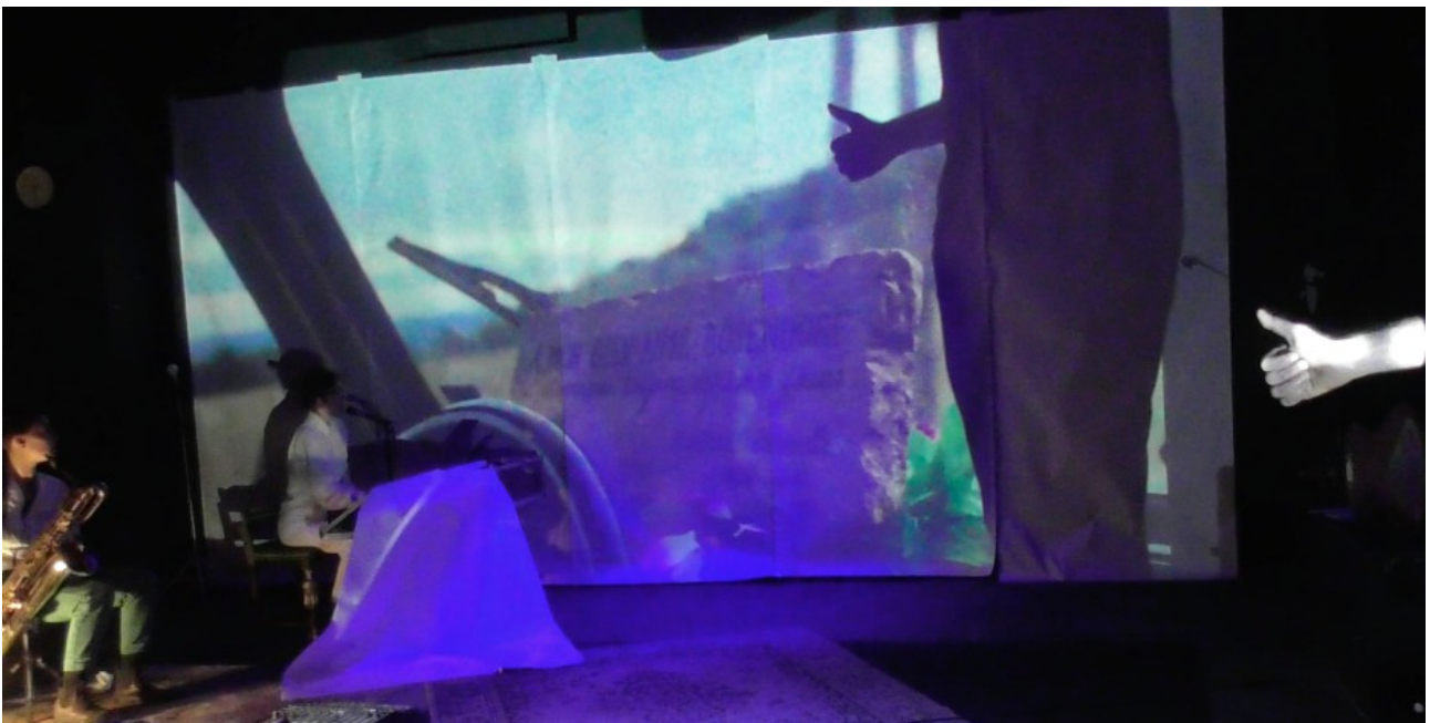
Image de répétition, novembre 2024

Cette forme nécessite un espace noir et silencieux.